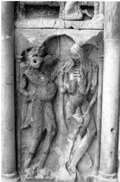
Bajorrelieve del portal (lateral izquierdo) de la iglesia abacial de Moissac

Al leer las críticas, observo que éste es uno de los aspectos de la novela que menos ha impresionado a los lectores cultos, o al menos diría que ninguno, o casi ninguno, lo ha puesto de relieve.