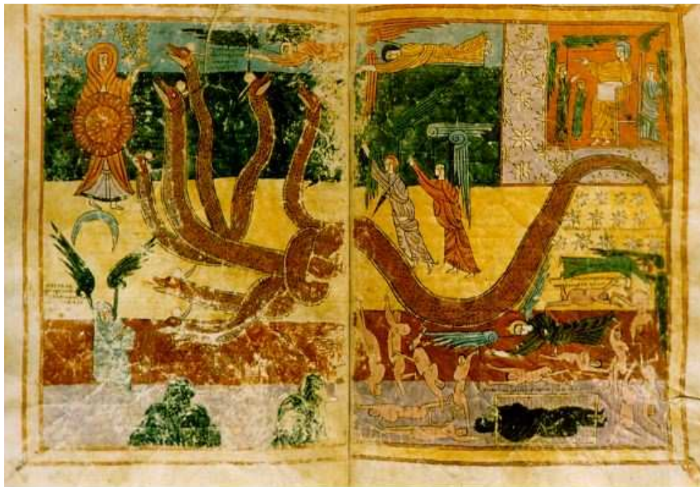
Ilustración al Apocalipsis 12, 1-6 (la mujer envuelta en el sol y el dragón) según el Comentario del Beato de Liébana,

Quisiera poner un ejemplo de cómo contar es pensar con los dedos. Es evidente que toda la escena de la relación sexual en la cocina está construida con citas de textos religiosos, desde el Cantar de los Cantares hasta San Bernardo y Jean de Fecamp o Santa Hildegarde von Bingen. Hasta las personas que no están familiarizadas con la mística medieval, pero que tienen un poco de oído, se dieron cuenta. Sin embargo, cuando alguien me pregunta a quién pertenecen las citas y dónde acaba una y empieza otra, ya no estoy en condiciones de decirlo.