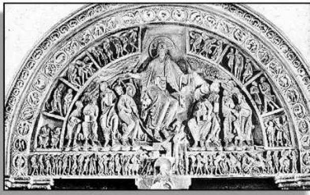
Tímpano del portal principal de la basílica de Sainte-Madeleine en Vezelay (Borgoña), h. mediados del s. XII

Por ejemplo, ¿por qué en mi libro aparecen los fraticelli del siglo XII? Si debía escribir una historia medieval, hubiese tenido que situarla en el siglo XIII, o en el XII, que conocía mejor que el XIV. Pero necesitaba un detective, a ser posible inglés (cita intertextual), dotado de un gran sentido de la observación y una sensibilidad especial para la interpretación de los indicios. Cualidades que sólo se encontraban dentro del ámbito franciscano, y con posterioridad a Roger Bacon; además, sólo en los occamistas encontramos una teoría desarrollada de los signos; mejor dicho, ya existía antes, pero entonces la interpretación de los signos era de tipo simbólico o bien tendía a leer en ellos la presencia de las ideas y los universales. Sólo en Bacon y en Occam los signos se usan para abordar el conocimiento de los individuos. Por tanto, debía situar la historia en el siglo XIV,