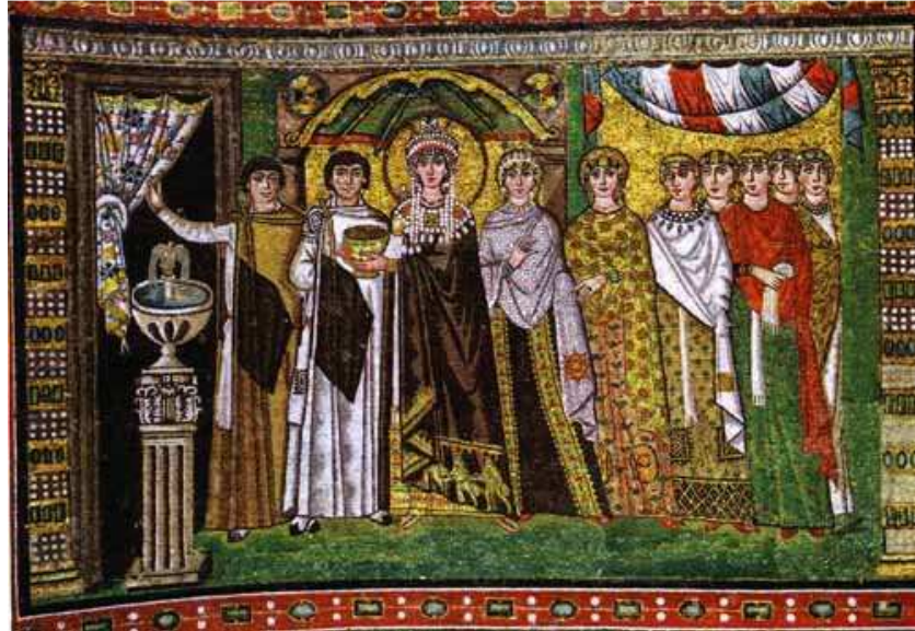
La emperatriz Teodora y su corte, mosaico de la iglesia de San Vitale en Rávena, h. mediados del s. VI

«El abad hizo una señal festiva y la procesión de las vírgenes entró en la sala. Era una rutilante fila de hembras ricamente ataviadas, en el centro de las cuales primero me pareció percibir a mi madre, pero después me di cuenta del error, porque sin duda se trataba de la muchacha terrible como un ejército dispuesto para la batalla. Salvo que llevaba sobre la cabeza una corona de perlas blancas, en dos hileras, mientras que otras dos cascadas de perlas descendían a uno y otro lado del rostro...» (Sueño de Adso en El nombre de la rosa, pp. 519-520)