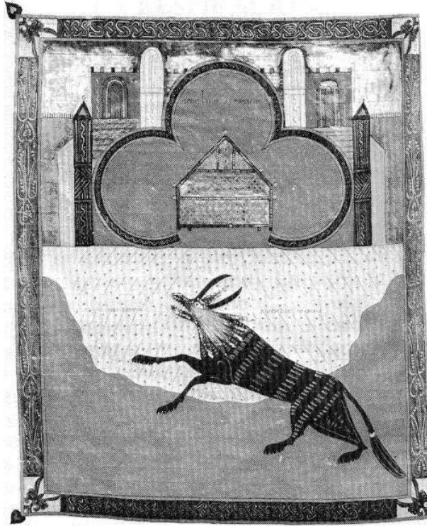
Miniatura del Comentario al Apocalipsis del Beato de Liébana, terminado en 1407 por el miniaturista Facundus; folio 148 v del Beatus de San Isidoro de León, Madrid, Biblioteca Nacional, vitrina 14-2.

«La bestia que sube del abismo les hará la guerra y los vencerá y les quitará la vida... Y se abrió el templo de Dios, que está en el cielo, y se dejó ver el arca del testamento.» (Apocalipsis 11, 7 y 19)