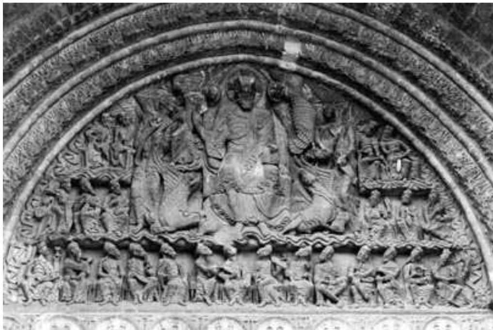
Tímpano del portal de la iglesia abacial de Moissac (Gascuña), h. principios del s. XII, que ilustra el Apocalipsis 4, 1-11

La idea de El nombre de la rosa se me ocurrió casi por casualidad, y me gustó porque la rosa es una figura simbólica tan densa que, por tener tantos significados,