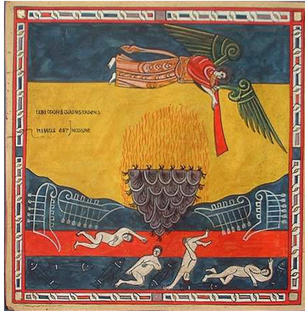
Ilustración al Apocalipsis 8, 8-9, folio 166 del man. cit

entró en contacto directo, sin la mediación de los contenidos, con el hecho de que es imposible que exista una historia.