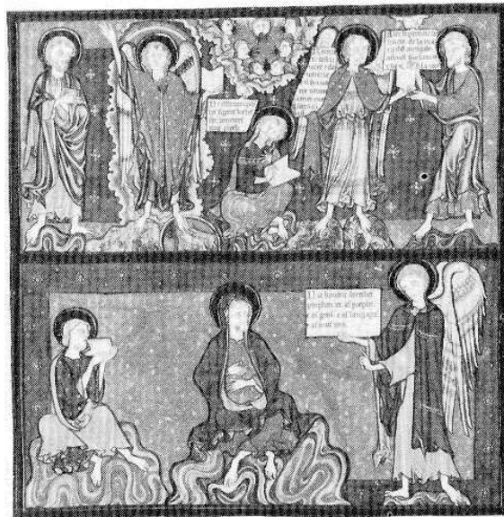
Ilustración al Apocalipsis 10, 8-11

En cambio, en la novela histórica no es necesario que entren en escena personajes reconocibles desde el punto de vista de la enciclopedia. Piensen en Los novios : el personaje más conocido es el cardenal Federico, que pocos conocían antes de Manzoni (mucho más conocido era el otro Borromeo, San Carlos). Sin embargo, todo lo que hacen Renzo, Lucia o Fra Cristoforo sólo podía hacerse en la Lombardía del siglo XVII. Lo que hacen los personajes sirve para comprender mejor la historia, lo que sucedió. Aunque los acontecimientos y los personajes sean inventados, nos dicen cosas sobre la Italia de la época que nunca se nos habían dicho con tanta claridad.