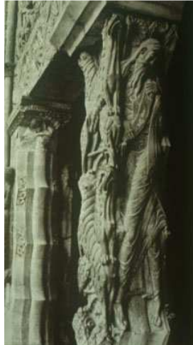
Columna central del portal de la iglesia abacial de Moissac

«¿Qué representaban y qué mensaje simbólico comunicaban aquellas tres parejas de leones entrelazados en forma de cruz dispuesta transversalmente, rampantes y arqueados, las zarpas posteriores afirmadas en el suelo y las anteriores apoyadas en el lomo del compañero?» (Adso de Melk en El nombre de la rosa , p. 57)